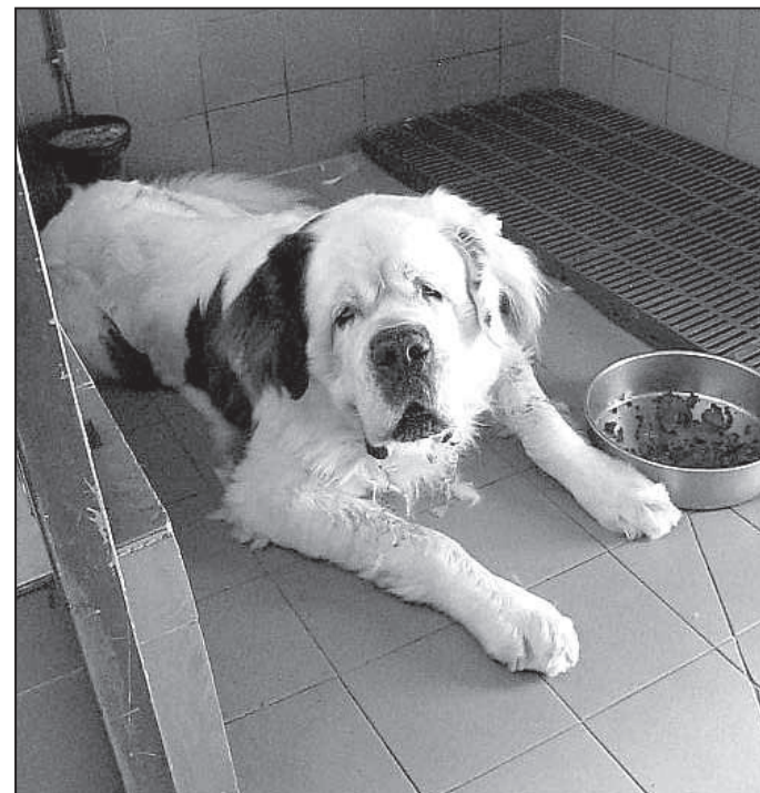
Archimede: vecchio san Bernardo di 9 anni, dopo la morte del suo anziano proprietario e dopo una vita vissuta in famiglia è stato trasferito senza pietà nel mega canile fuori provincia dove ormai vecchio e disperato si sta lasciando andare: diamogli una possibilità di finire i suoi giorni nel calore di una casa...