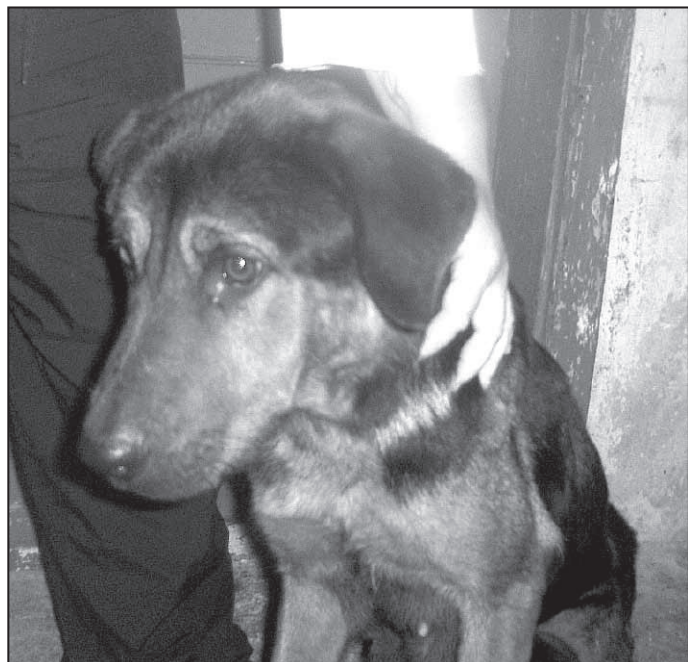
Aska: È una femmina incrocio Pastore tedesco - Rottweiler dal carattere dolce ed equilibrato, buona con i bambini, davvero una creatura meravigliosa, delicata ed attenta con i gatti li allontana ma non li tocca fisicamente. Davvero sarebbe una crudeltà farla finire in un canile, ma questa sarà la sua sorte se non sarà adottata dopo aver svezzato con tanto amore e pazienza i suoi nove meravigliosi cuccioli nati per un attimo di disattenzione del proprietario.